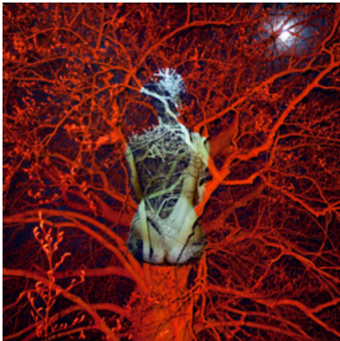
Tomaž Črnež / iz serije Doneski k slovanski mitologiji