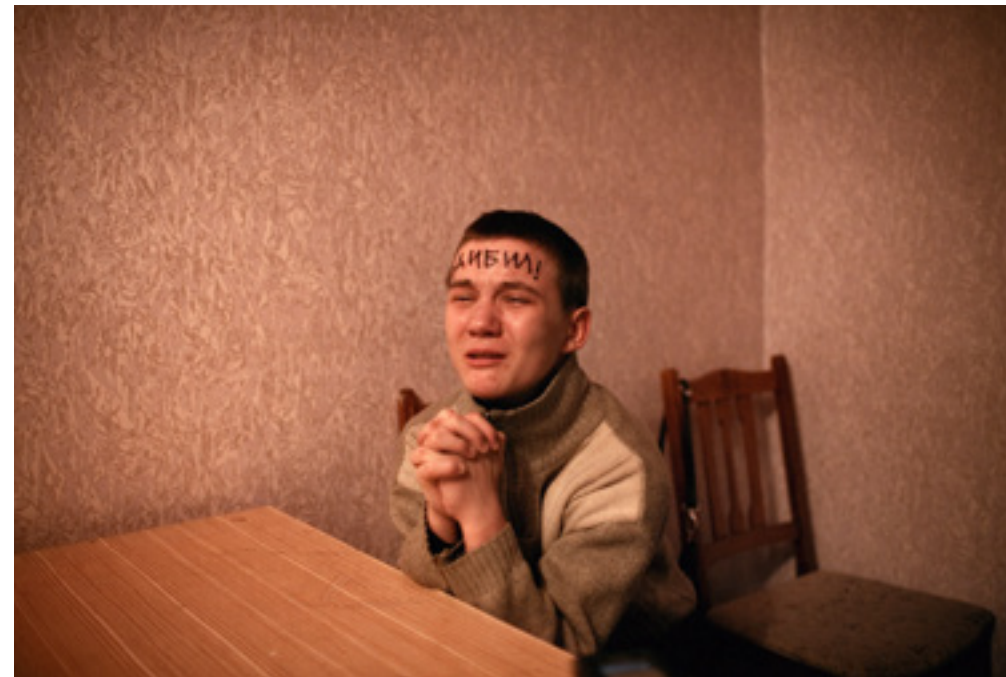
Donald Weber / iz serije Interrogations

V sodelovanju z Galerijo Plevnik – Kronkowska.